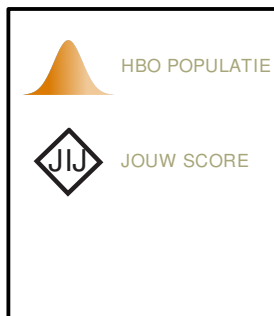
Fig. 1 JOUW SCORE

Je had 30 vragen van de 38 goed. Dit betekent dat je ver boven gemiddeld scoort vergeleken met andere personen op HBO-niveau.