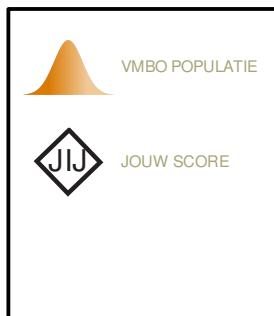
Fig. 1 JOUW SCORE

Je had 15 vragen van de 25 goed. Dit betekent dat je beneden gemiddeld scoort vergeleken met andere personen op VMBO-niveau.