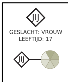
Fig. 1 JOUW SCORES