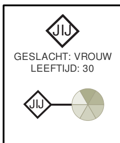
Fig. 1 GROEPSROLLEN

Hieronder staat grafisch weergegeven hoe belangrijk je elk van de rollen vindt. Uitgebreide uitleg per rol staat daarna in de volgorde waarin je ze belangrijk vindt.